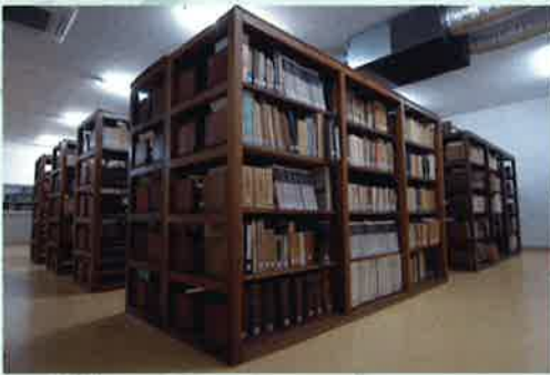
創造館収蔵庫の貴重な資料

日時：平成23年7月2日(土) 午後1時30分から4時 会場：伊那市創造館 3階講堂