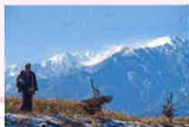
映画「ほかいびと」より