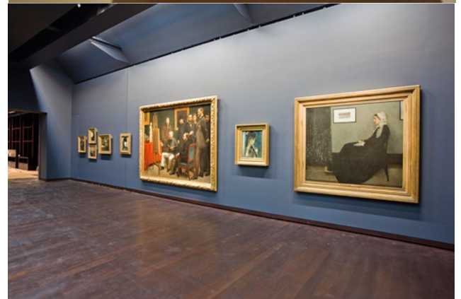
壁の影響 新生オルセー美術

http://www.mmm-ginza.org/special/201202/special01.html