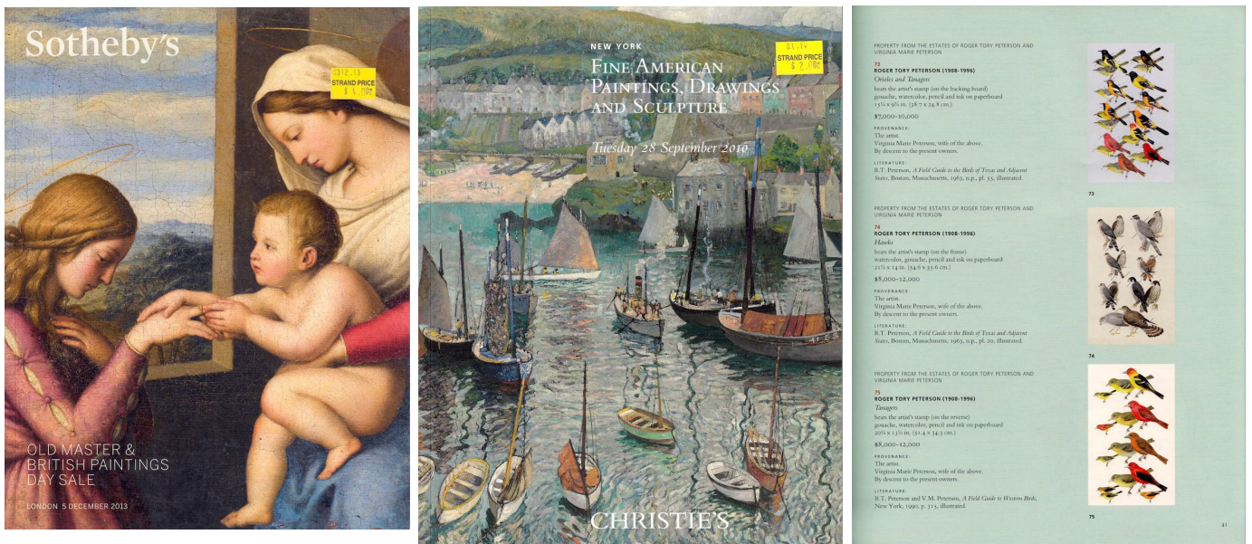
左：Sotheby's Old master & British paintings, Day sale. London 5 December 2013. 269x210, 144pp. 中、右：Christies New York, Fine American paintings, drawings and sculpture Tuesday 28 September 2010. 265x210, 166pp.