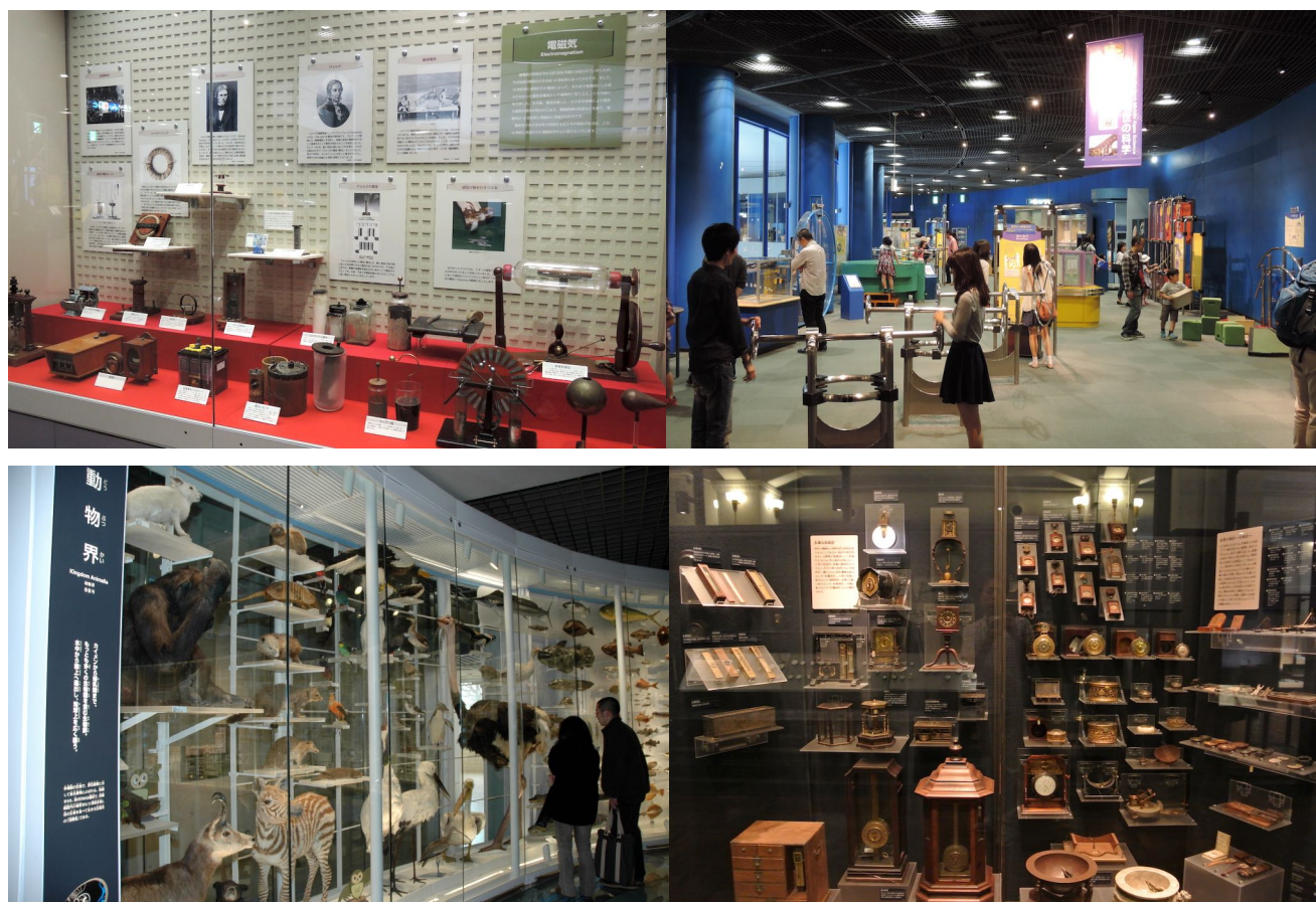
上段 大阪市立科学館の展示室 左：科学史の展示、右：展示装置がならぶ科学館の展示 下段 国立科学博物館の展示室 左：自然史展示、右：科学史あるいは産業史の展示

自然史とは natural history の直訳であり、自然誌や博物学とも訳される。現在は自然史の訳語で落ち着いている。博物館の分類で、美術館や歴史博物館などを人文系の博物館、自然史博物館や科学館を科学系や理工系という分け方を使う場合があるが、自然史博物館と科学館の展示は全く異なる。自然史博物館の展示は自然物に情報を与えた標本、つまり実物資料が基本である。それに対し、科学館の展示は資料ではなく、物理現象や自然現象を再現する展示装置が根幹である。惑星の重力を再現する装置、光の屈折を体験する装置、天体の運行を映し出すプラネタリウムなど。科学館にロケットや天体望遠鏡などの実物資料が展示されているが、そのような展示は科学史の展示といった方がふさわしい。そして科学史の展示は人類の文化史を扱う人文系である。