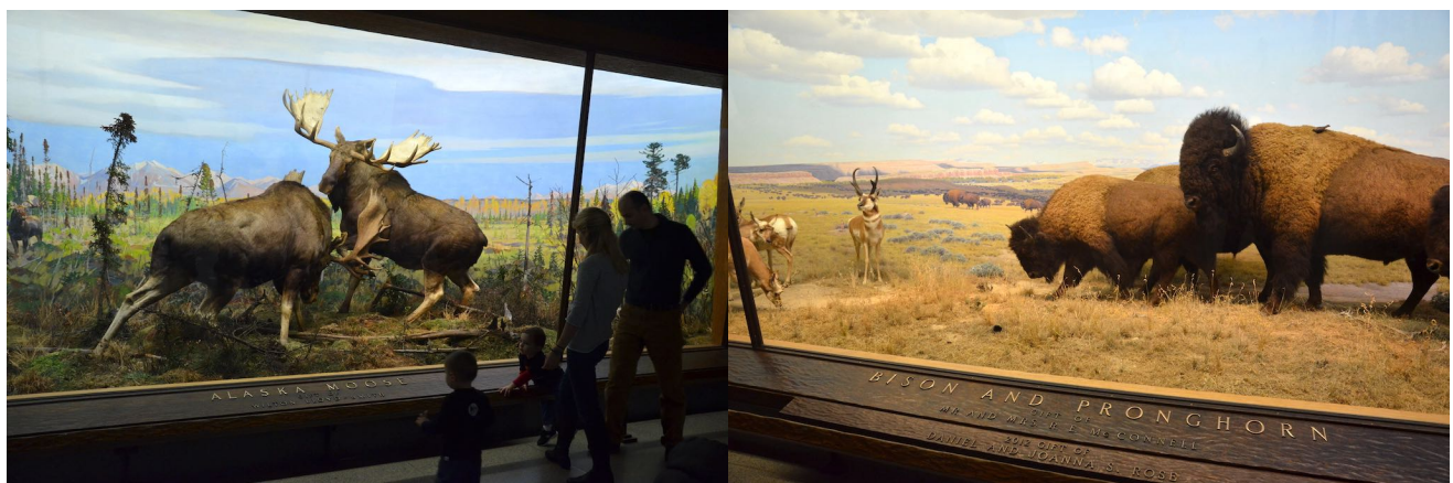
アメリカ自然史博物館のジオラマ。背景画も剥製も精巧に作られ迫力十分である

とくに著名な展示例はニューヨークのアメリカ自然史博物館 American Museum of Natural History のジオラマで、1930年代に作成された。カラー写真の普及以前でテレビも存在しない時代にあって、ジオラマは臨場感あふれる映画のように鑑賞された。