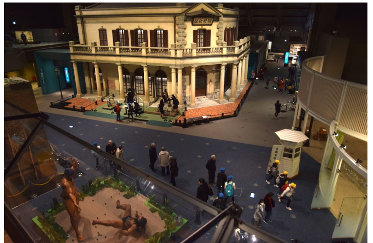
江戸東京博物館リニューアル （トータルメディア開発研究所）

国立西洋美術館「ロンドン・ナショナル・ギャラリー」「ハプスブルク展」「ゴッホ展」、国立科学博物館「恐竜展2019」「大英自然史博物館展」など