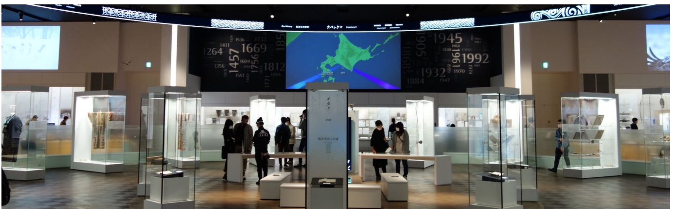
2020年7月12日に開館した国立アイヌ民族博物館常設展示室（北海道白老町）設計：丹青社、施工：日展