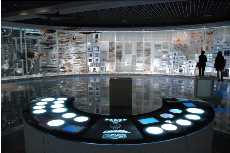
国立科学博物館地球館（2004オープン）丹青社