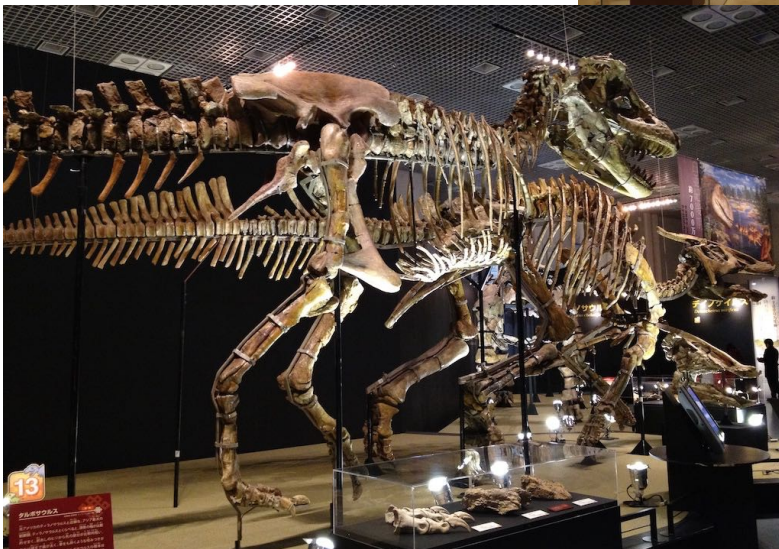
国立科学博物館特別展「大恐竜展—ゴビ砂漠の驚異」（2013）日展