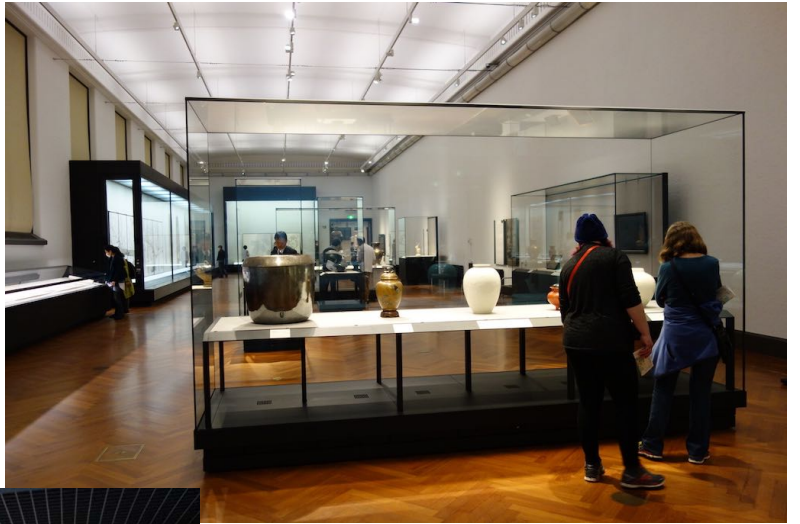
東京国立博物館本館平常陳列