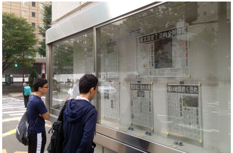
新聞の展示。北海道新聞社本社ビル 2018.9.7 9月6日午前3時7分に発生した北海道胆振東部地震を伝える

人間には何かを表現する欲求があり、コレクションを見せたくもある。同様に国や組織、企業や商店も展示を利用する。世界は展示で満たされている。だから、展示一般と博物館の展示は区別して考える必要がある。