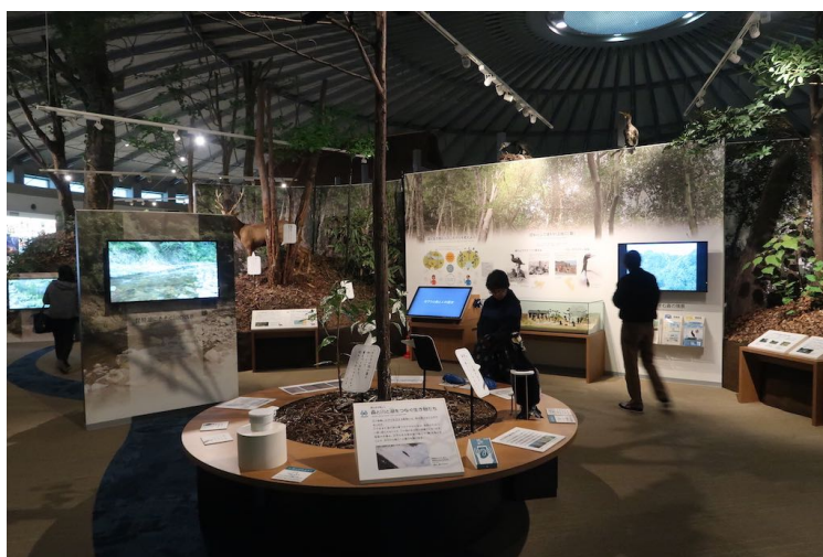
滋賀県立琵琶湖博物館第1期リニューアル（乃村工藝社）

代表作は長崎歴史文化博物館 https://www.nomurakougei.co.jp/achievements/detail/128