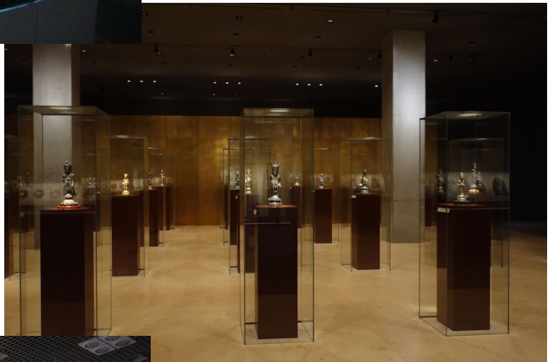
東京国立博物館法隆寺宝物館