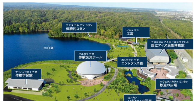
ウポポイ園内マップ