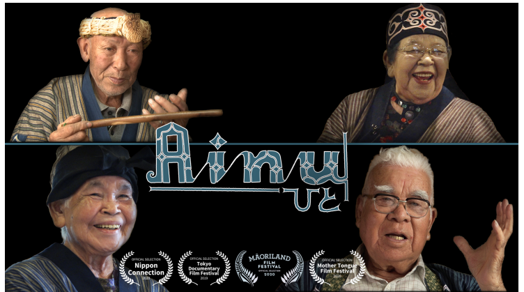
ドキュメンタリー映画「Ainu | ひと」 http://www.garafilms.com/ja/home/

経済的な実用性を失った技術や物品は、祭や土産品として利用生産が続いている。それらは単純な伝統の継承だけでなく、新たな意匠や工芸品、芸術作品などが生み出されており、現在もアイヌ文化は生きり再生している。また、アイヌ文化を学ぼうという人たちがアイヌとそれ以外の出自を持つ人の両方に生まれている。