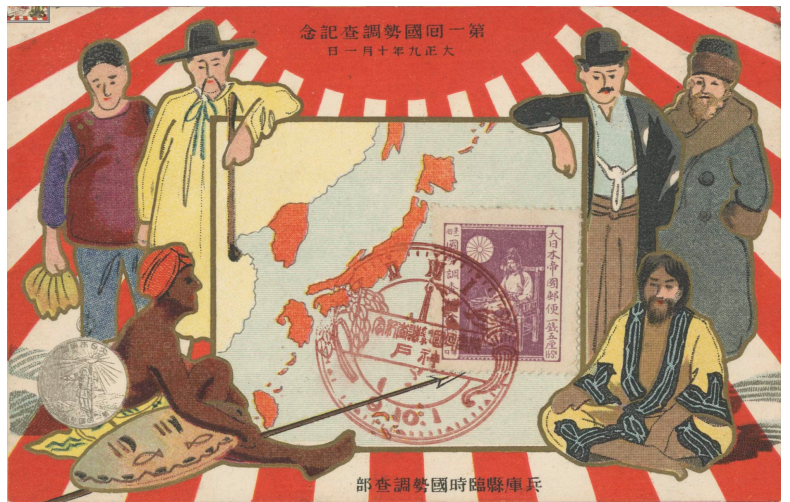
多民族国家が描かれた第一回国勢調査記念絵はがき (1920) https://kutsukake.nichibun.ac.jp/CHO/detail.html?id=250073

本土文化の内部での多様性は、現在ではテレビ番組のように県を単位に表現されている。が、県によっては旧藩や旧国の違いが強調されることもある。たとえば愛知県での尾張と三河、静岡県の遠州と駿河と伊豆など、県としての統一の将来を不安視する記事があるほど。国民レベルでは東西の文化の差として意識される。そこでも認識が異なる場合があり、名古屋は西日本か東日本のどちらかを問うと、関東と関西では答えが異なると想像する。つまり西日本と東日本の境界は人によって認識が異なる。