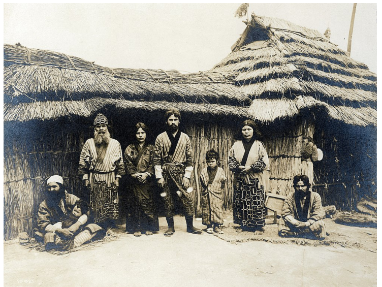
セントルイス万博（1904）で「展示された」アイヌ一家 https://commons.wikimedia.org/wiki/File:Ainu_Group_from_Japan_in_Department_of_Anthropology_exhibit_at_the_1904_World%27s_Fair.jpg

方針は1）アイヌ施策（生活向上や文化振興、地域・産業・観光の振興、アイヌ語の復興とアイヌ文化の振興と普及、2）差別の解消、3）国や法人との連携。内水面でのサケ捕獲の儀式での特別な配慮を明記。