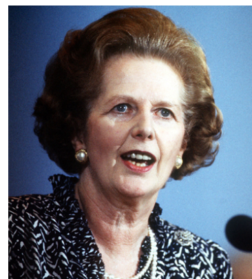
マーガレット・サッチャー首相

https://www.japanjournals.com/feature/great-britons/3910-margaret-thatcher-44415757.html