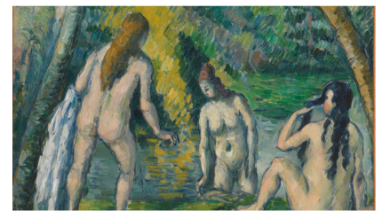
02-14 | セザンヌ「The Inauguration」1876年 © CC0 Paris Musées / Musée des Beaux-Arts de la Ville de Paris / Fotofest