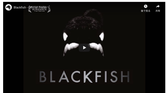
上：The Cove ポスター 下：Blackfish 公式サイト