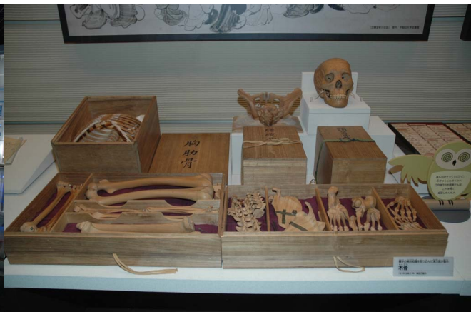
地球館2階木製骨格標本 科博は科学史や技術史の展示もある

国立科学博物館の概要と沿革 http://www.kahaku.go.jp/about/summary/history/index.html