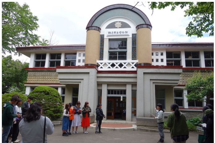
登録有形文化財「網走市立郷土博物館」2019年登録

（1995.1）を契機として、1996年の文化財保護法の改正で実現した。平成初期から具体的な調査が始まっていた近代化遺産に法的位置付けを与える役割もあり、近代の文化財がおもな対象となっている。文章表現としては「登録文化財に登録された」となる。