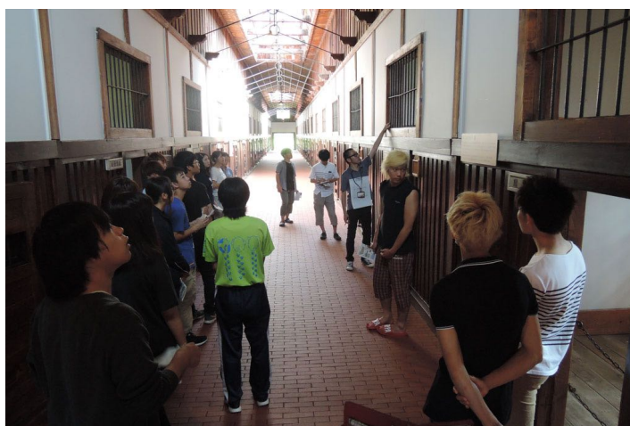
重要文化財「五翼放射状平屋舎房」（網走監獄）2016年指定