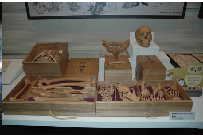
地球館2階木製骨格標本 科博は科学史や技術史の展示もある

国立科学博物館の概要と沿革 http://www.kahaku.go.jp/about/summary/history/index.html