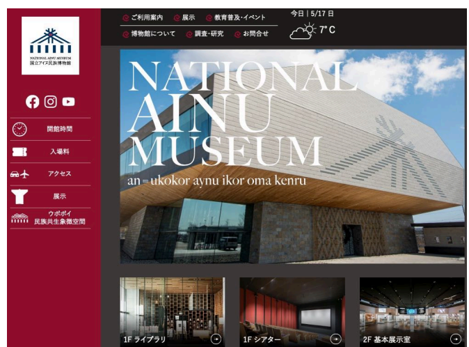
2020年7月12日に開館した国立アイヌ民族博物館

文化財保護法を根拠とする国立の博物館は他に、国立美術館6館（東京国立近代美術館、京都国立近代美術館、国立映画アーカイブ、国立西洋美術館、国立国際美術館、国立新美術館）がある。