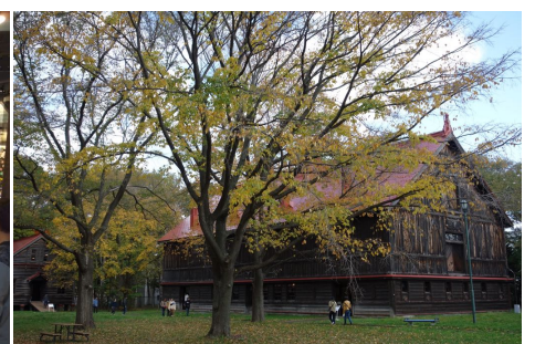
札幌農学校第2農場