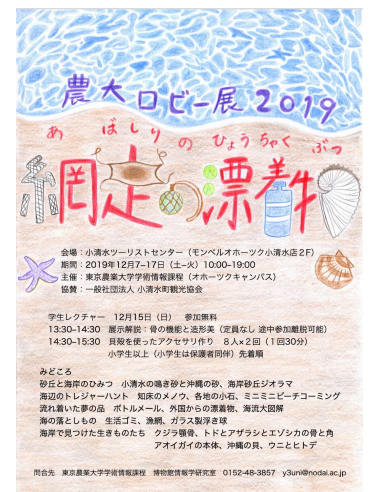
農大口ビー展2019ポスター 黒田美空(アクアバイオ学科) NHKの取材は会場前に張り出されていたポスターを見たことがきっかけだった

今回の資料を用いた企画展が、標津サーモン科学館で2020年2-4月に開催されている。