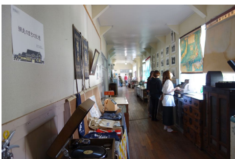
網走市立郷土博物館丸万収蔵庫