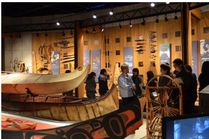
北海道立北方民族博物館