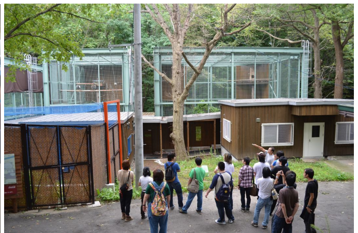
札幌市円山動物園鳥類野生復帰訓練施設