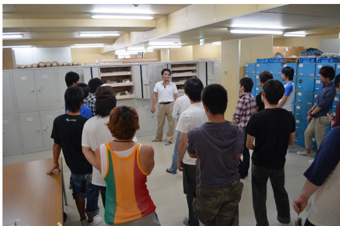
北海道大学植物園博物館新収蔵庫