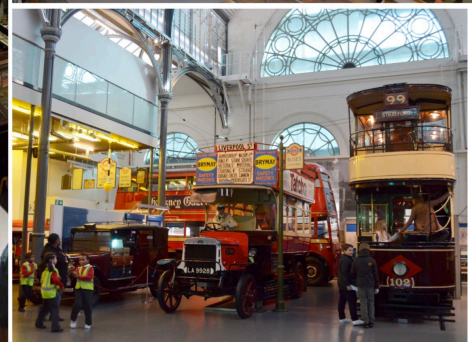
イギリスの博物館 資料に人が集う

上から下へ、左列：アッシュモレアン考古美術博物館 Ashmolean Museum of Art and Archeology、大英博物館 The British Museum 中央：自然史博物館 The Natural History Museum、ピットリバーズ博物館 Pitt Rivers Museum 右列：オックスフォード科学史博物館 Museum of the History of Science, Oxford、科学博物館 The Science Museum、ロンドン交通博物館 London Transport Museum