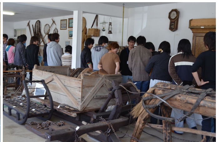
網走市立博物館丸万収蔵庫