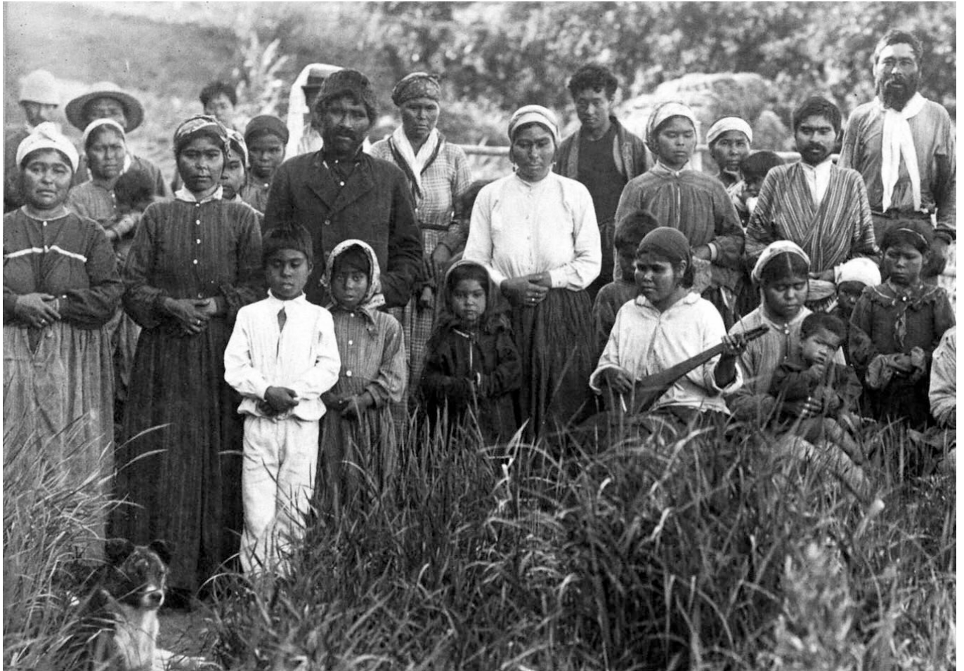
1888（明治21）年の色丹島の千島アイヌ