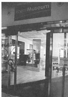
写真3. 郷土博物館といえるブレント博物館。