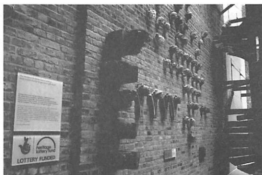
写真2. 文化遺産宝くじ基金の助成及び寄贈者を示すプレート。ビクトリア&アルバート美術館。