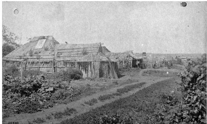
R. ヒッチコック撮影の1888年の網走と常呂（左下）（アメリカ国立人類学アーカイブ蔵）