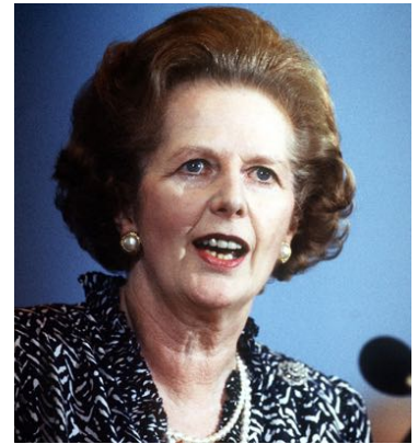
マーガレット・サッチャー首相

https://www.japanjournals.com/feature/great-britons/3910-margaret-thatcher-44415757.html