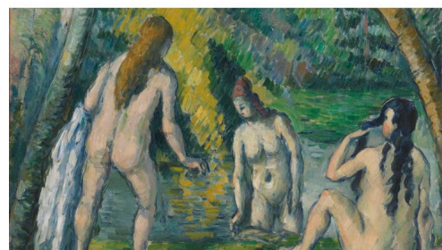
ポール・セザンヌ Trois baigneuses 1879-82 CC0 Paris Musées / Musée des Beaux-Arts de la Ville de Paris, Petit Palais