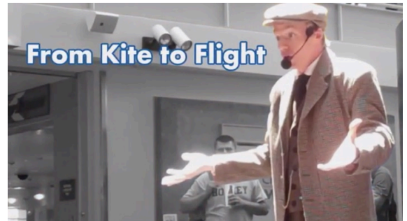
The Children's Museum of Indianapolis の俳優によるライブパフォーマンス。日本では少ない http://www.youtube.com/watch?v=4I0PJ4CLiVE

利用者に直接対応する教育活動は対象者がきわめて少人数であり、結果的に特定の人だけが受益者となってしまう可能性がある。また、高度な内容をほぼ対価を得ないでおこなうため、考え方によっては民業圧迫といえるかも知れない。