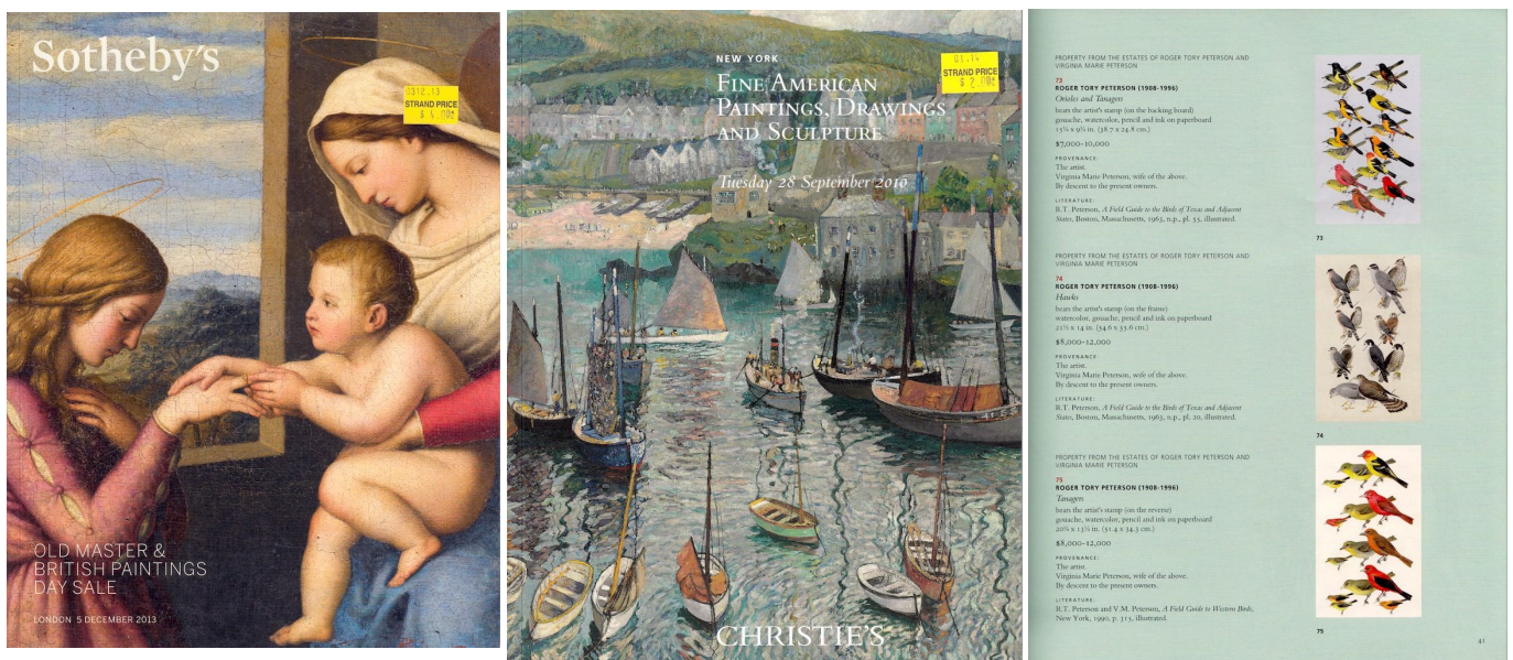
左：Sotheby's Old mater & British paintings, Day sale. London 5 December 2013. 269x210, 144pp. 中、右：Christies New York, Fine American paintings, drawings and sculpture Tuesday 28 September 2010. 265x210, 166pp.

美術品は自由市場の規模が大きく、見た目のわかりやすさからニュースでも盛んに取り上げられる。サザビーズ Sotheby's やクリスティーズ Christies といった大手オークション会社では美術館の図録のようなカタログを用意してオークションに備える。ここでは美術館も入札に参加する。