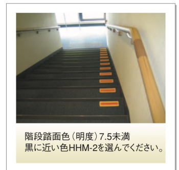
階段踏面色(明度)7.5未満 黒に近い色HHM-2を選んでください。

階段識別マーク 日本ハートビル工業株式会社 http://www.jhb.co.jp/catalog/pdf_no19/no19_04.pdf