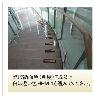
階段踏面色(明度)7.5以上 白に近い色HHM-1を選んでください。