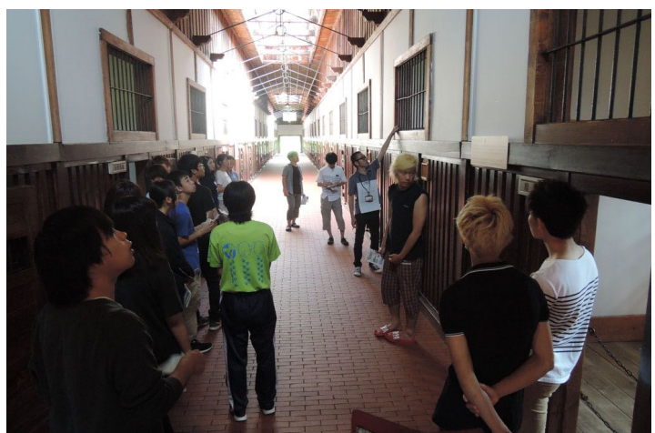
重要文化財「五翼放射状平屋舎房」（網走監獄）2016年指定