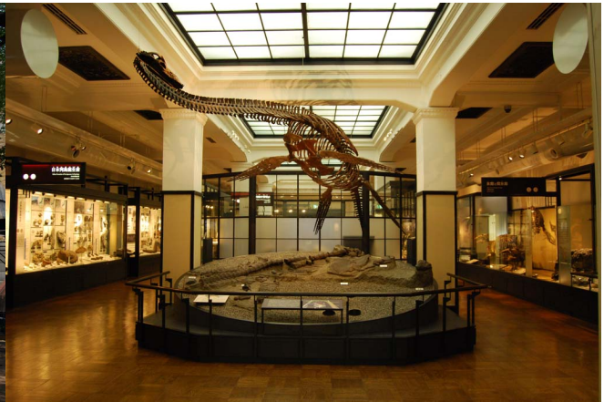
日本館3階北翼フタバスズキリュウ