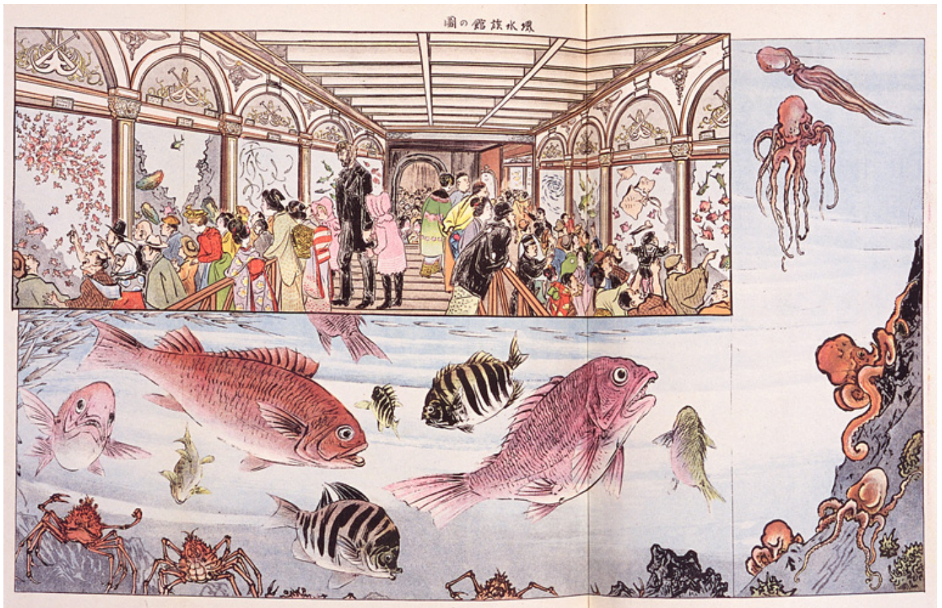
山本松谷「堺水族館の図」『風俗画報』臨時増刊269号（明治36.6.10） https://www.ndl.go.jp/exposition/data/R/355r.html

堺水族館のあゆみ | 堺市 https://www.lib-sakai.jp/kyoudo/kyo_digi/sakaikoutoohama/kyo_digi_sui.htm