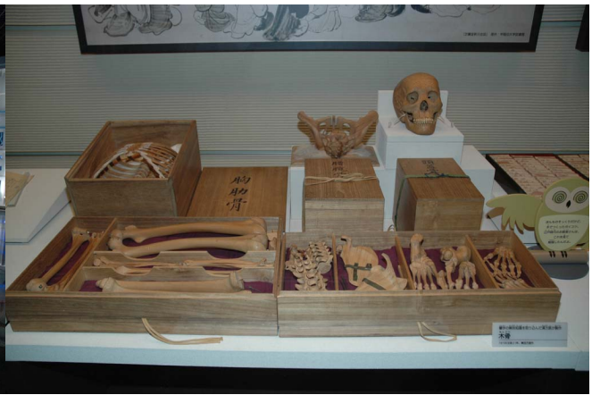
地球館2階木製骨格標本 科博は科学史や技術史の展示もある

国立科学博物館の概要と沿革 http://www.kahaku.go.jp/about/summary/history/index.html