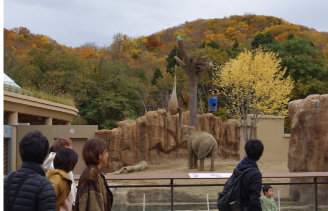
上：草地で繁殖するフンボルトペンギンには池の周囲に営巣環境を整備（埼玉県こども動物自然公園）