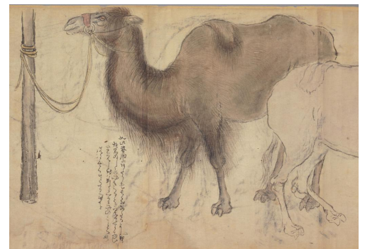
江戸時代末に渡来したフタコブラクダ https://www.ndl.go.jp/nature/cha3/index.html

動物園のルーツのひとつは間違いなく見世物小屋である。見世物やショーは必ずしも悪ではなく、博物館法でも博物館の目的に「レクリエーション」を明記している。野生動物をペットとして飼うことは良くて、見世物にするのは悪いというのは一つの見方であり、善悪の基準を自覚する必要がある。無料ならば許されるのか。そうであれば悪いのは金銭の授受なのだろうか。