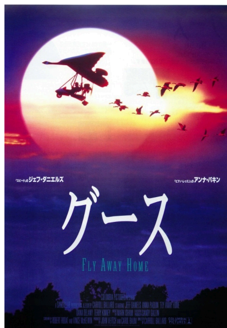
グース / ポスター画像 - 映画.com https://eiga.com/movie/43928/photo/

渡り鳥が目の前！ 一緒に空飛ぶ絶景映像 http://natgeo.nikkeibp.co.jp/atcl/news/18/011000007/