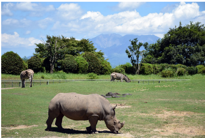
近藤典生が設計した景観展示。桜島をキリマンジャロに見立てた。鹿児島市平川動物公園